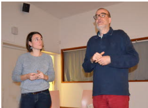
Les parents de la famille « Zéro déchets ».